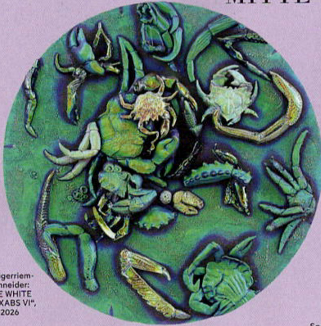
Neugerriemschneider: PAE WHITE „CRXABS VI“, 2026