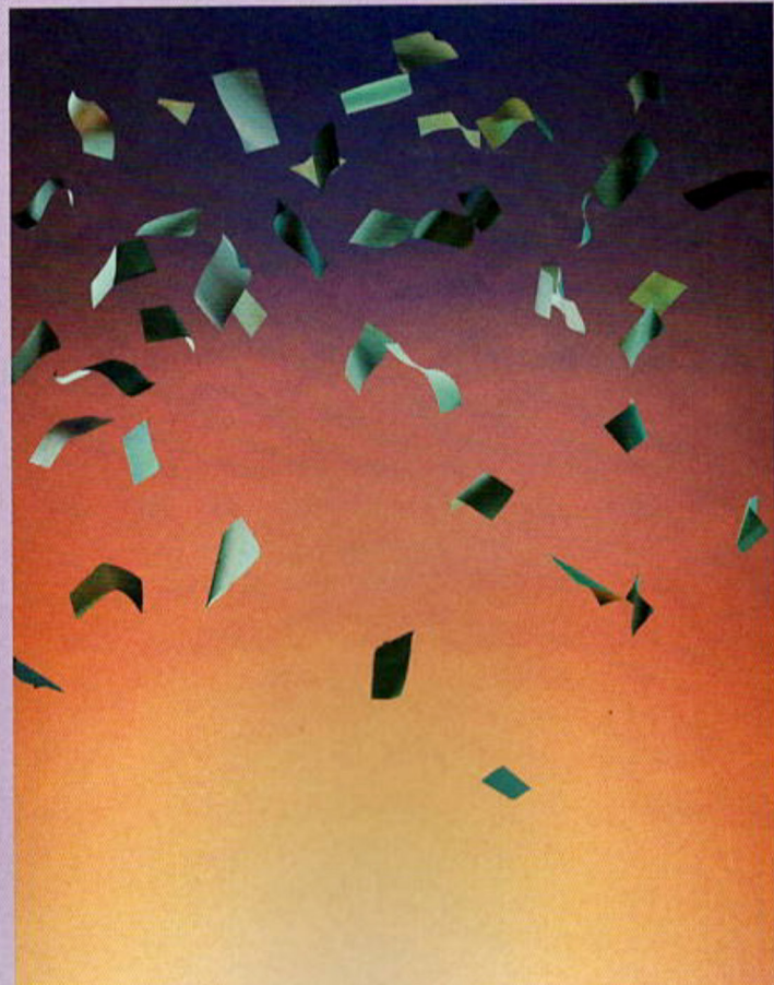
Sprüth Magers: THOMAS DEMAND „Money“, 2025

E s krecht und krabbelt bei NEUGERRIEMSCHNEIDER in der Christinenstraße. In ihrer Schau mit dem charmanten Titel „pushmi-pullyu“ zeigt die 1963 in Pasadena geborene Amerikanerin Pae White überlebensgroße Insekten, Krabben und kaleidoskopische Wandskulpturen. In ihrem facettenreichen Werk schaut White gern auf das, was man übersieht, weil es klein und unscheinbar ist: in diesem Fall Krabben, Schnecken und Fliegen. Ihr Galeriekollege Jorge Pardo betreibt am Hauptsitz der Galerie in der Linienstraße eine besondere Form der Mimikry: Er scannt Werke des Postminimalismus, druckt sie aus und übermalt die Bilder, bis etwas gänzlich Neues entsteht, das man schwer einordnen kann. Epigonenhaft ist es jedenfalls nicht, eher eine Möglichkeit, sich beim Aneignen einer etablierten künstlerischen Handschrift weitertreiben zu lassen. Hinzu kommen Licht- und Soundarbeiten.