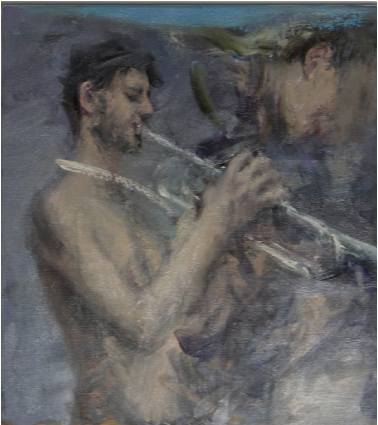
Cornel Brudașcu Untitled Trumpeter and Portrait in the Background, 2015

Ceea ce au în comun artiștii prezenți în expoziție nu este doar identitatea locală sau națională, ci un sentiment de apartenență, de nostalgie pentru trecut și de anxietate față de prezentul precar. În ciuda diferitelor experiențe de viață pe care le-au avut, în timpul comunismului și în timpul schimbărilor dramatice care au urmat în anii lungi de tranziție, acești artiști au depășit trauma istoriei îmbrățișând o nouă paradigmă care a combinat abordarea conceptuală a artei vestice cu tradiția picturii figurative. Succesul acestui fenomen stă în atitudinea reflexivă care implică nu doar o filtrare a rupturilor dintre istorie și timp, prezență și memorie, ci și un proces de transfigurare care tinde spre auto-descoperire”, scrie Cristina Beliger în Transilvania Reporter , relevând totodată scurte caracterizări ale celor nouă artiști.