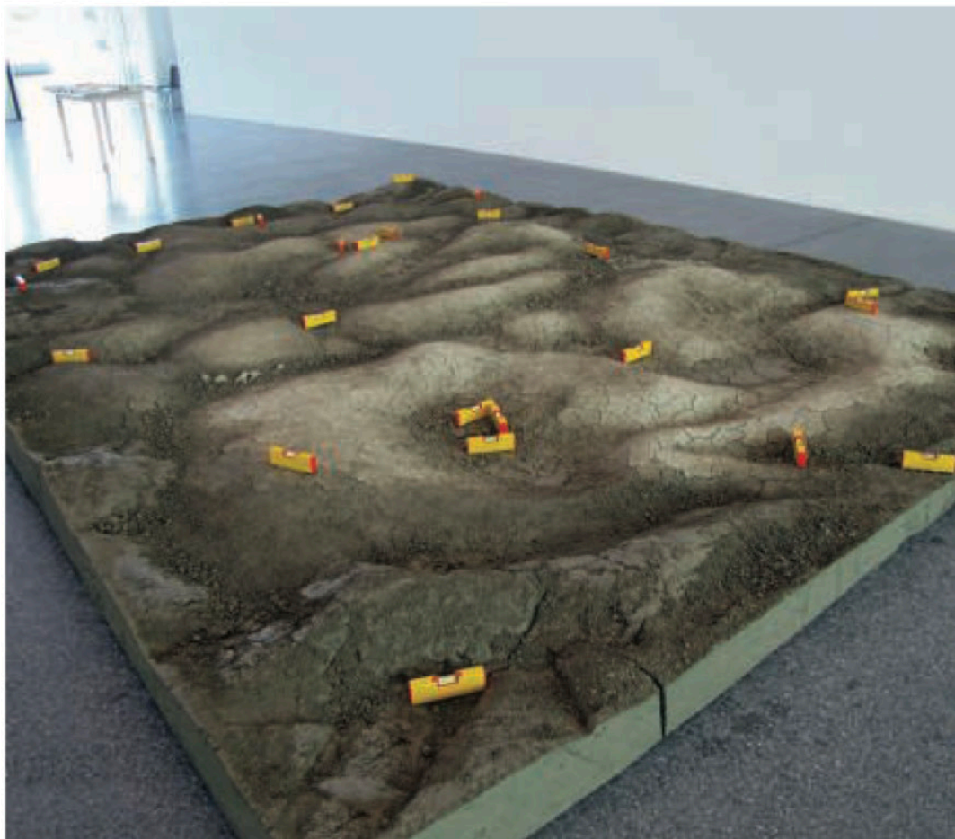
Miklós Onucsan, Re-așez orizontala apei , 2011, instalație site-specific, (pământ argilos, nivele cu bulă de aer), dimensiuni variabile. Courtesy of the artist

„De fiecare dată când sunt întrebat despre «statement-ul artistic» sau despre «filozofia» din spatele lucrărilor mele, am tendința de a răspunde scurt: «Este ușor să pui întrebări!». Iar asta fără să invoc neapărat privilegiul tăcerii, rezervat artistului vizual, dar totuși fără a-l ignora. Lucrările mele nu s-au născut ca mărturii ale unei filosofii pre-formulate, încercând să o ilustreze. Ele nu sunt lucrări făcute din vreun fel de știință, ci din neștiință. Ele nu sunt răspunsuri, ci modurile în care eu îmi pun întrebări. Iar dacă aceste lucruri înseamnă ceva și pentru alții, atunci este cu atât mai bine.”